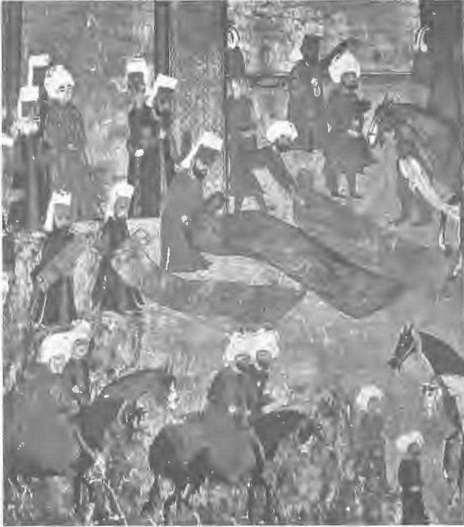
Resim 1. Surname, yaklaşık 1582, Şehzade Mehmed'in Atmeydanı'ndaki İbrahim Paşa Sarayına gelişi. Topkapı Sarayı Müzesi Kütüphanesi. Yeniçeriler, şehzadenin geçeceği yolları top top seraserlerle* döşemişlerdi.